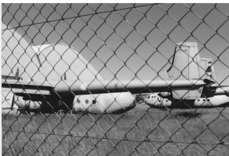
Geen open dag... wel een dump met twee Noratlassen. (Nancy-Essay, 1997, Eric Schel)